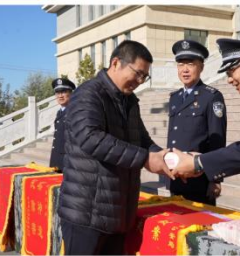
10月25日，在吉木萨尔县公安局举办的涉案财物返还仪式上，民警向受害群众返还现金。

活动现场返还了受害群众被盗窃、诈骗的现金以及被盗的汽车、摩托车、电子产品等价值70余万元的财物。受害群众将印有“雷霆出击，破案神速”“办案神速，为民除害”等字样的锦旗送到民警手中，对办案民警迅速破