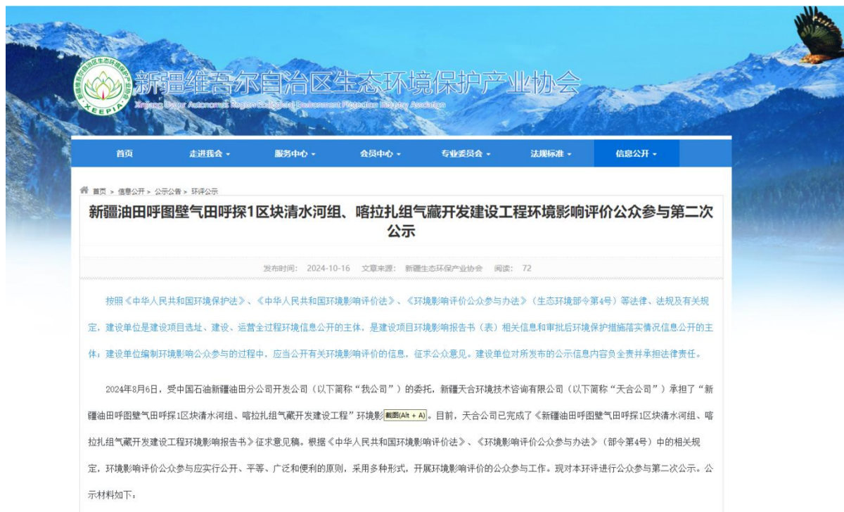
图 2 本项目征求意见稿网络公示截图