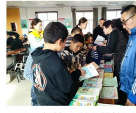
10月26日,在昌吉市阿什里乡多金湾坝村村委会会议室,村民正在领取图书和宣传手册。

本报讯 记者 蒋勇·马汗报道:10月26日,昌吉市阿什里乡多金湾坝村村委会会议室里热闹非凡,昌吉市委统战部、盟盟昌吉市支部在此开展了主题为“铸牢中华民族共同体意识”的社会服务活动。