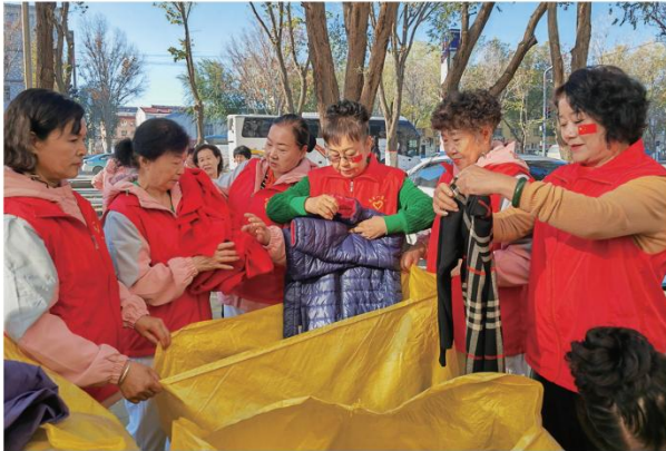
10月25日,“张第一家”爱心团队和爱心企业代表、志愿者们一起整理爱心衣物。

今年10月中旬以来,“张第一家”爱心团队陆续开展“衣暖情暖”志愿服务,为偏远地区农村儿童送来衣物、学习用品等,得到了广大志愿者和爱心人士积极响应。