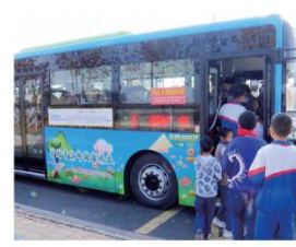
10月22日,玛纳斯县的学生正在排队乘坐“护苗”主题公交车。

本报讯 通讯员 丁慧琴、曹彩霞报道:10月22日,玛纳斯县“护苗”主题公交车“上线”。