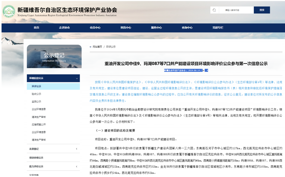
图 2-1 项目公众参与第一次信息公示截图