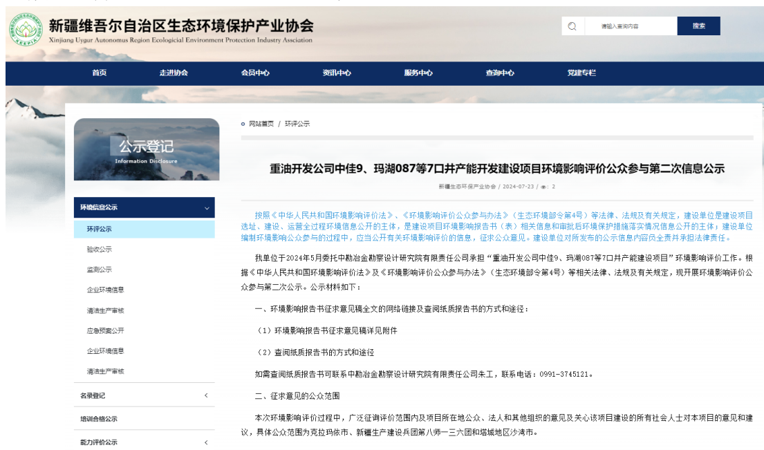
图 3-1 项目公众参与第二次信息公示截图

中国石油新疆油田分公司重油开发公司于 2024 年 07 月 24 日在新疆维吾尔自治区生态环境保护产业协会网站刊登了项目第二次公众参与信息公示 ( http://www.xjhbcy.cn/articles/show/13794 ), 载体选择符合《环境影响评价公众参与办法》要求。公示截图请见图 3-1。