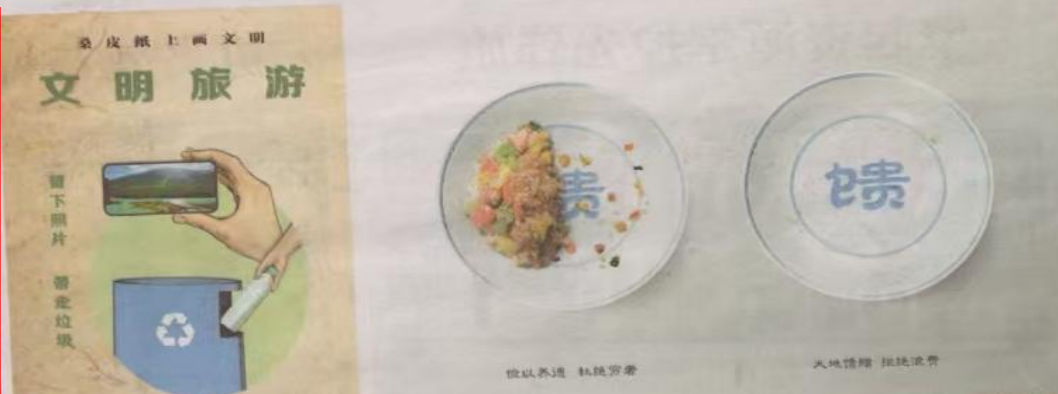
图4 第二次报纸公示——新疆日报报纸页面

克拉玛依区城市管理局委托新疆天合环境技术咨询有限公司编制的《克拉玛依生活垃圾焚烧发电项目环境影响评价报告书》(征求意见稿)已完成,现进行环境影响评价信息公开。请公众在10个工作日内提出与建设项目环境影响评价有关的意见和建议。项目环境影响评价报告书征求意见稿全文网络链接: http://www.xjhbcy.cn/blog/article/13650 。项目公众意见表网络链接: http://www.xjhbcy.cn/hbcysh/xs/gk/255400/hjyxpjgzcys/284162/index.html 。