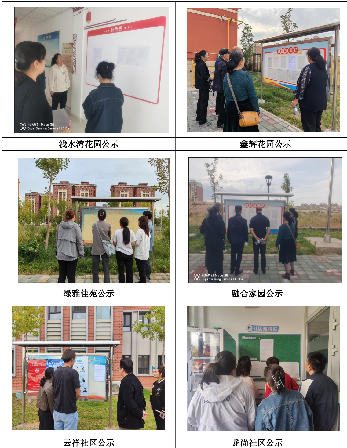
图 5 张贴公示现场照片