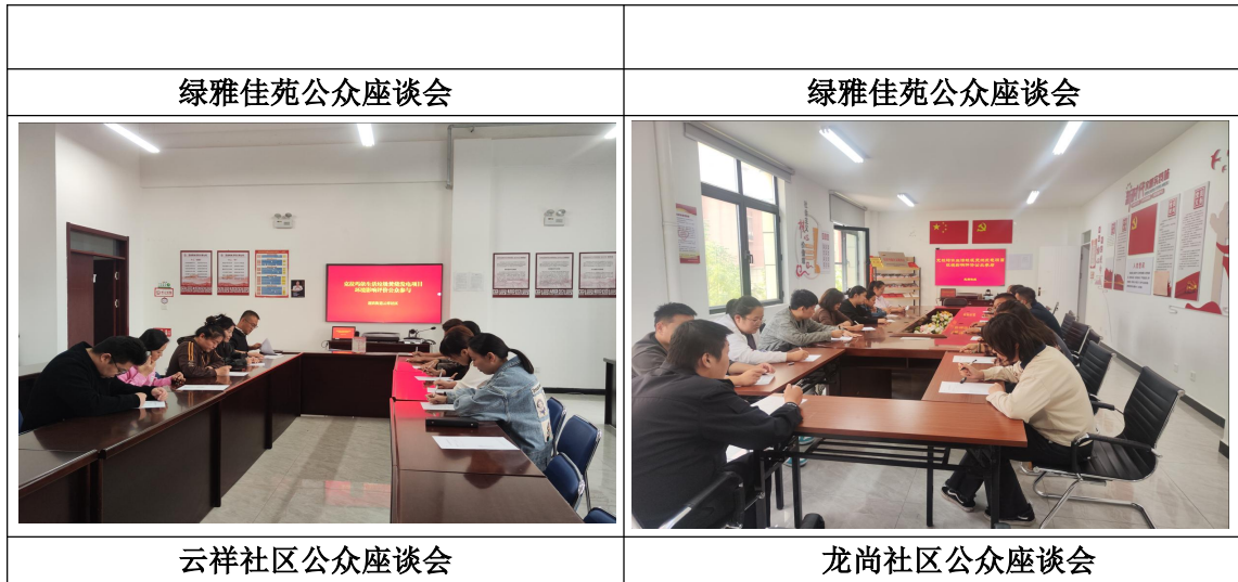
图 7 公众座谈会现场照片