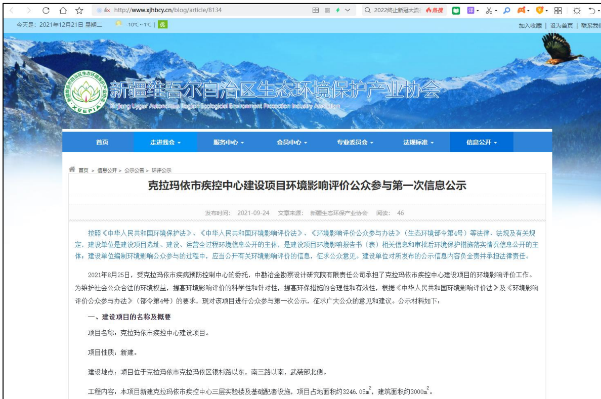
图 2-1 项目第一次公众参与公示截图