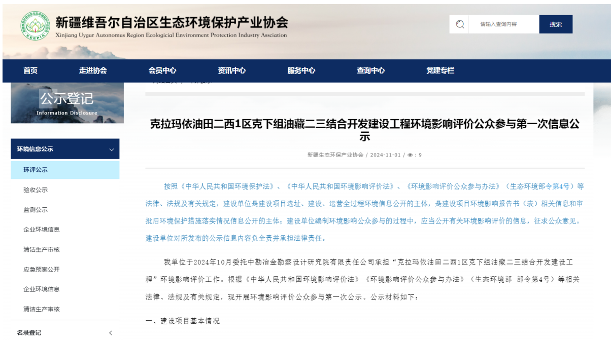
图 2-1 项目第一次公众参与公示截图