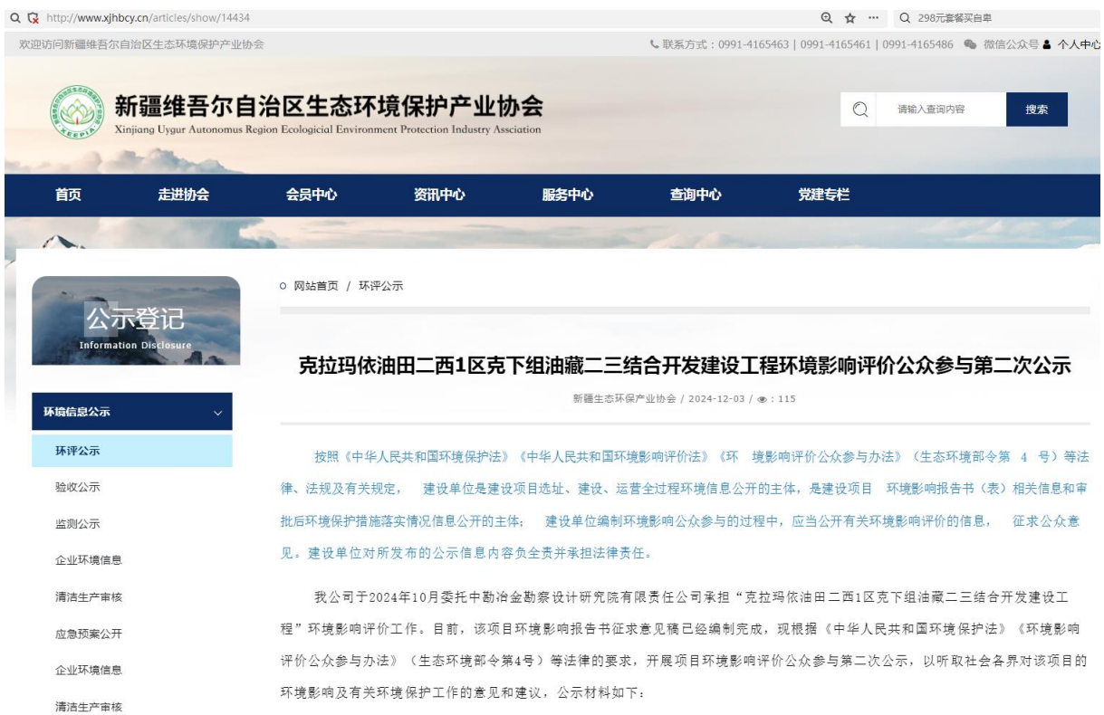
图 3-1 项目第二次公众参与公示截图

中国石油新疆油田分公司开发公司于 2024 年 12 月 03 日在新疆维吾尔自治区生态环境保护产业协会网站刊登了项目第二次公众参与公示信息（ http://www.xjhbcy.cn/articles/show/14434 ），载体选择符合《环境影响评价公众参与办法》要求。公示截图详见图 3-1。