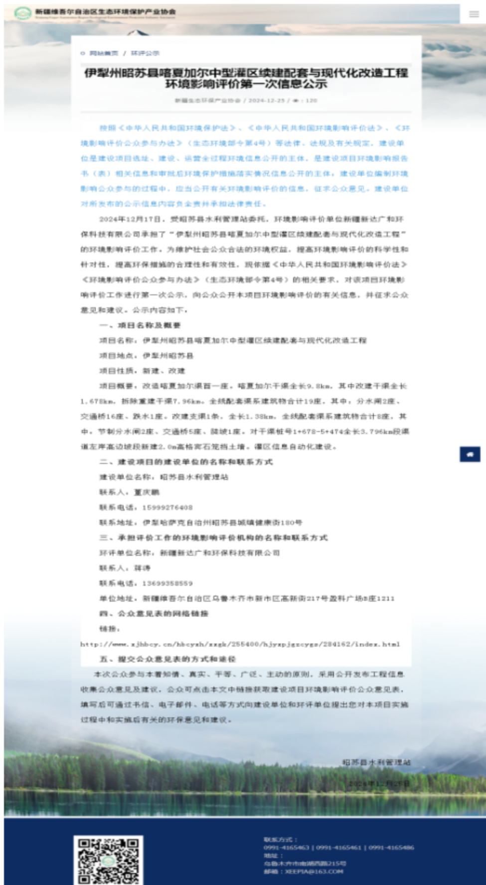
图 2-1 本项目第一次网络公示截图