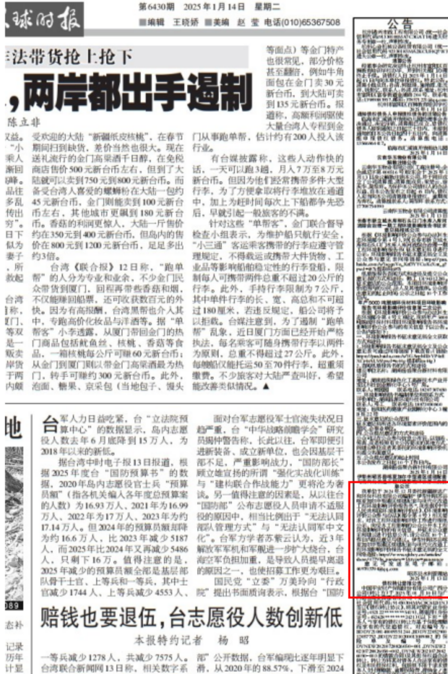
图3-2 本项目第一次报纸公示截图

在第二次网络公示期间，昭苏县水利管理站分别 2025 年 1 月 14 日及 2025 年 1 月 20 日，在环球上对本项目的环境影响评价信息进行了两次公示，载体选择和公示时间符合《环境影响评价公众参与办法》要