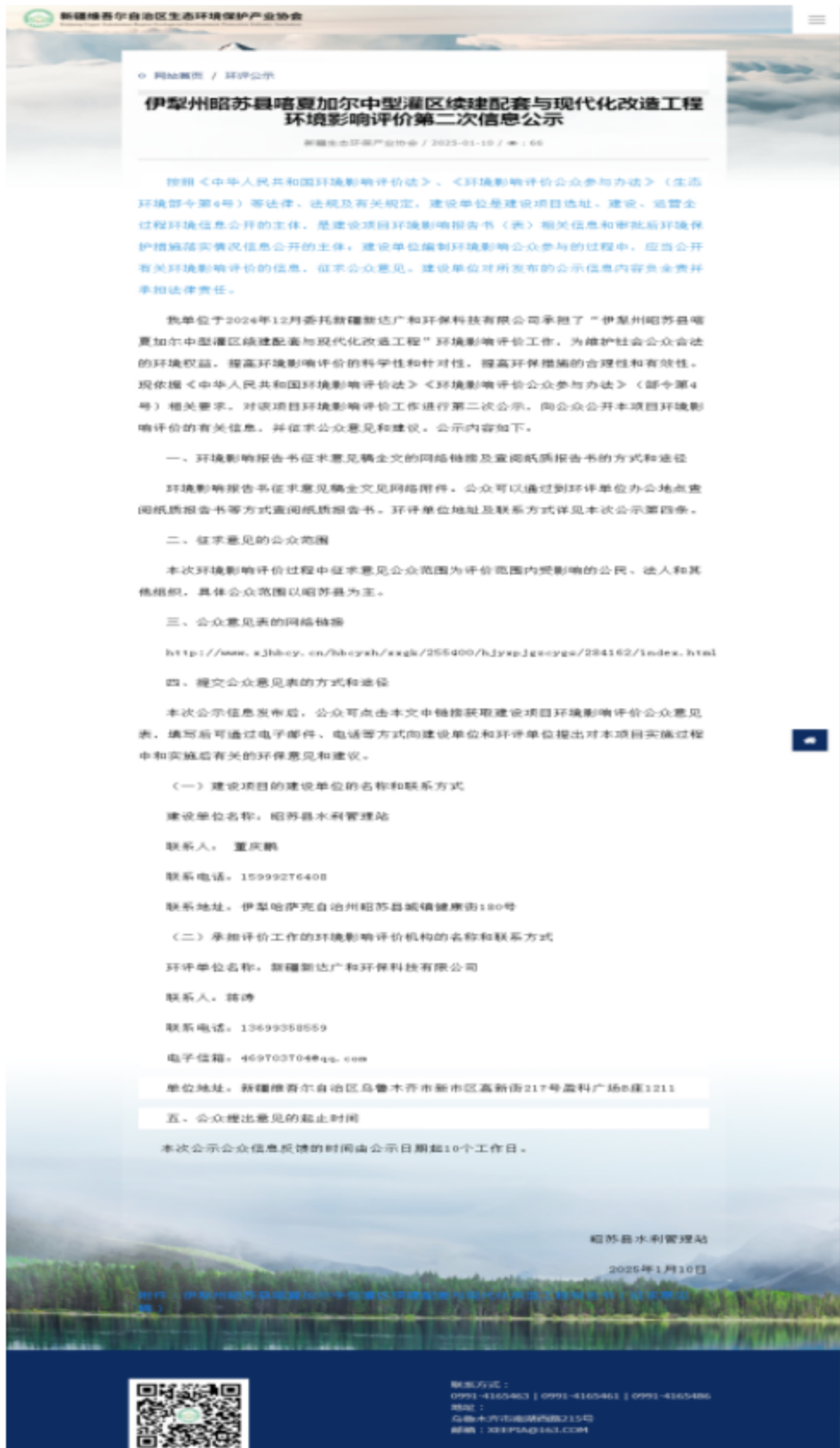
图 3-1 项目第二次公众参与公示截图