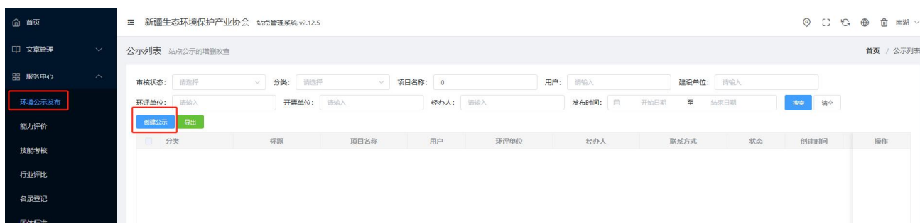
图 管理平台公示发布页面